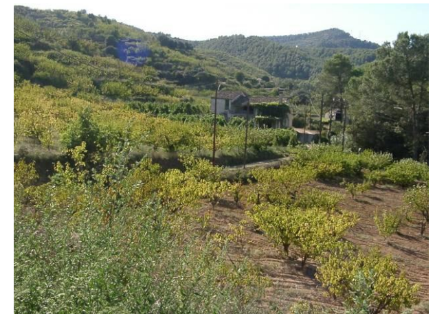
Cal Mixerris Vell