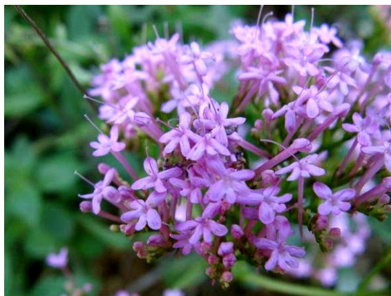
Herba de Sant Jordi

Quan s'acaba el camí pavimentat, abans de l'última casa veiem a l'esquerra una barraca d'obra. Es va construir aprofitant un antic dipòsit d'aigua de la primera instal·lació de subministrament d'aigua canalitzada a una part del poble.