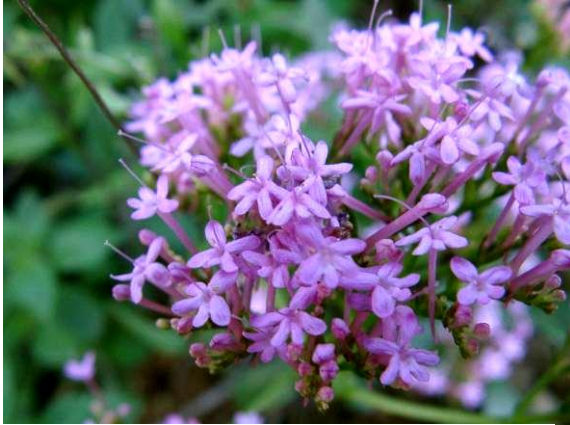
Herba de Sant Jordi

Quan s'acaba el camí pavimentat, abans de l'última casa veiem a l'esquerra una barraca d'obra. Es va construir aprofitant un antic dipòsit d'aigua de la primera instal·lació de subministrament d'aigua canalitzada a una part del poble.