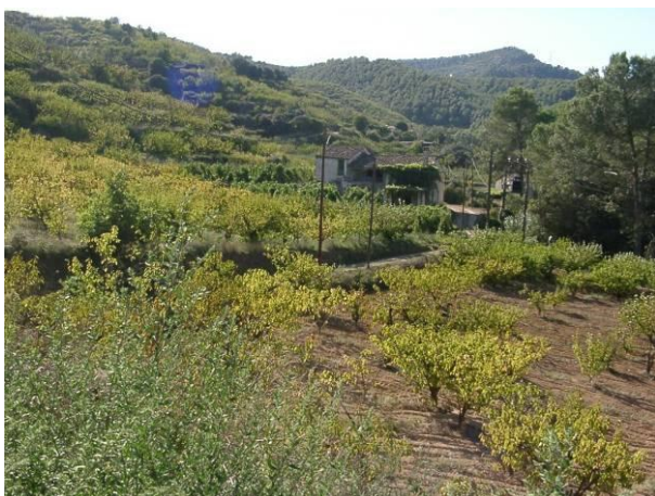
Cal Mixerris Vell

Inici i acabament: plaça de l'Ajuntament