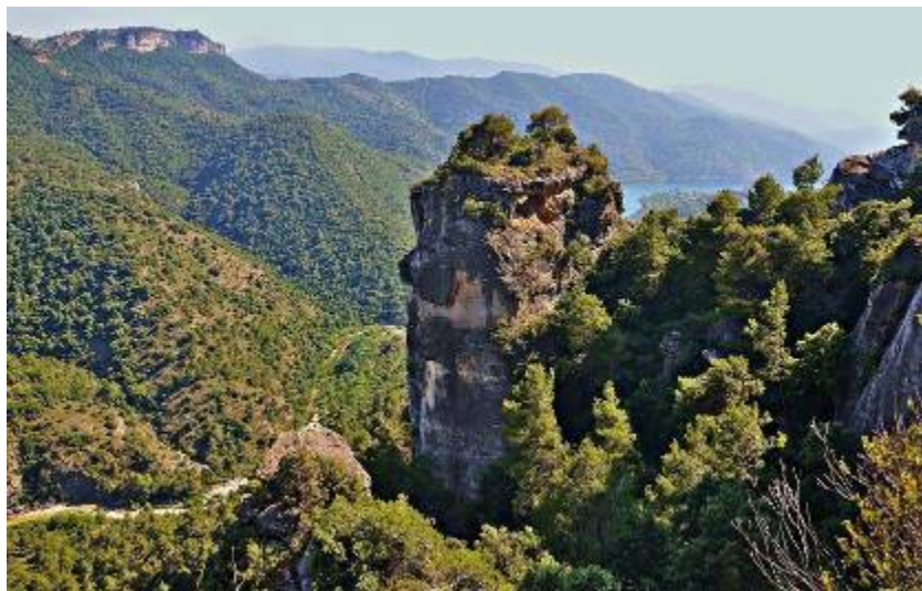
Cingles calcaris a la zona sud-oest, a la capçalera del Siurana CEDIDA.

Sembla mentida que les muntanyes de Prades hagin arribat als nostres dies sense ser parc natural quan la protecció de l'espai ja es preveia a la planificació de la República, el 1931. El retard s'ha produït en part per la protecció especial i primerenca del bosc de Poblet amb la figura de paratge natural d'interès nacional (PNIN) el 1984. Ja el 1988 el Centre d'Estudis de la Conca de Barberà (CECB) reclamava el parc natural en un monogràfic sobre l'espai. Inclòs lògicament al PEIN, la Xarxa Natura 2000 i les zones ZEPA, el 1998 es van declarar les reserves naturals parcials del Tillar i la Trinitat, el mateix any que el Parlament va aprovar una moció a favor del parc natural. Però no va ser fins al