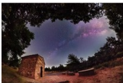
Vista de l'ermita de Sant Roc i el seu entorn, sota el cel estrellat de Prades. Parc Astronòmic Muntanyes de Prades

El Parc Natural de les Muntanyes de Prades, Poblet i la Serra de la Llena serà una realitat aquest estiu. Ho serà després de dècades de reclamació per part del territori i naixerà després d'un procés participatiu. L'objectiu: recollir visions i expectatives diferents sobre el futur espai per part de sectors com el primari o el sector serveis, així com la ciutadania, entitats i grups ecologistes, entre d'altres.