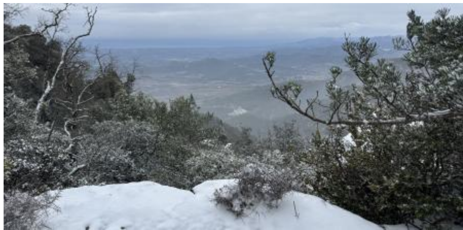
Nevada del gener a la Mussara, al Baix Camp, al cor del futur parc, amb vista al mar i la Costa Daurada. Lv.

A la carpeta de grans espais naturals pendents de protegir millor i, sobretot, de gestionar amb més eficiència a Catalunya, ocupen un lloc destacat les Muntanyes de Prades. Meravellós enclavament a l'interior de la Costa Daurada. Després de dues dècades d'espera, amb nombrosos incompliments polítics, el Departament de Territori està a punt de sotmetre al març, a la fi, a informació pública –amb 45 dies per presentar al·legacions– el decret de declaració del parc natural (PN) de les