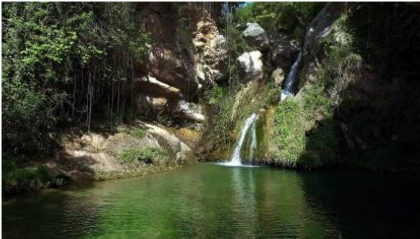
La vall del Glorieta, a Alcover, formarà part del Parc Natural.

Pel que fa a l'extensió, amb les seves 39.800 hectàrees el Parc Natural de les Muntanyes de Prades, Poblet i Serra de la Llena serà el segon parc natural més gran de Catalunya, només per darrere del de l'Alt Pirineu. Però si el que tenim en compte és el nivell de complexitat, el futur parc natural guanya per golejada. Ja es considerava prioritari durant la Segona República, i un cop acabada la dictadura hi va haver diferents intents de convertir-lo en una realitat, però ha estat impossible. Després de moltes promeses incomplertes i de canvis de calendari constants hi ha una data que, ara sí que sí, sembla que es complirà: