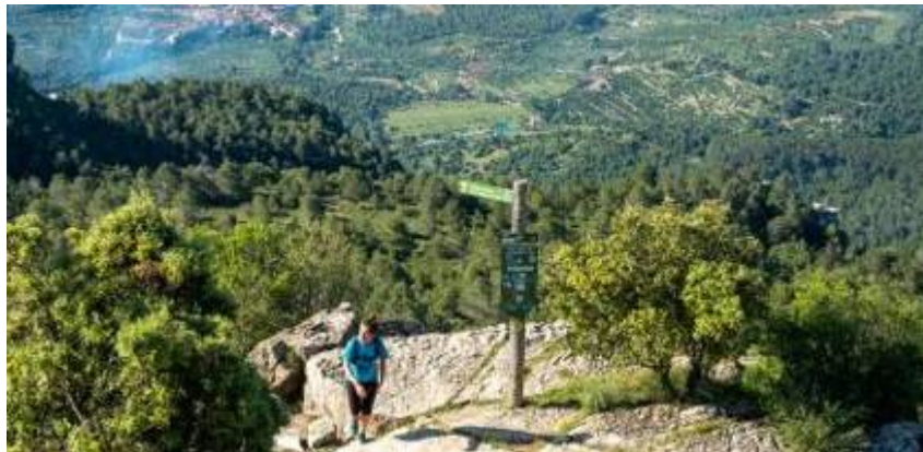
Excursionista pujant a la Mussara, a les muntanyes de Prades. Xavi Jurio

L'Ajuntament de Cornudella de Montsant (Priorat) ha aprovat en sessió plenària rebutjar la inclusió del municipi al futur parc natural de les Muntanyes de Prades, a la darrera fase de tramitació per part del Departament de Territori. Entre els arguments esgrimits pel govern local per deixar fora del nou parc 8.400 hectàrees del terme municipal, hi figura la "pèrdua total de capacitat de decisió i gestió per part dels propietaris i de l'Ajuntament".