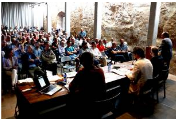
Acte a Montblanc de País Rural, aquesta tarda per mostrar disconformitat en alguns aspectes del futur parc natural ARNAU MARTÍNEZ/ACN.

L'Associació País Rural ha demanat aquesta tarda al Convent Sant Francesc de Montblanc que es reformi la Llei d'Espais Naturals de la Generalitat que data del 1985 i s'ha demostrat obsoleta "restrictiva i burocràtica". Sota el lema Volem el Parc Natural, però així no!, la jornada ha servit per obrir un espai de diàleg al voltant del model de Parc Natural proposat per la Generalitat per a les Muntanyes de Prades, Poblet i la Serra de la Llena, un projecte que preveu abastar 43.700 hectàrees i afectar 24 municipis del Baix Camp, Alt Camp, Conca de Barberà, Priorat i les Garrigues.