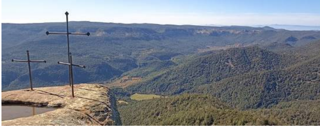
Les Tres Creus , a la mola dels Quatre Termes, a l'interior de les muntanyes de Prades XAVIER MIRÓ.

Set, afluent del Segre; el riu Siurana, afluent de l'Ebre, i els rius Francolí, Sec, Brugent i Glorieta –aquests tres darrers, afluents del primer. Amb 39.800 hectàrees de 22 municipis, serà el tercer parc natural més extens de Catalunya a darrere de l'Alt Pirineu i el Cadí-Moixeró. Connecta a l'oest amb el Parc Natural del Montsant i al sud-oest amb el PEIN de les serres de Pradell i l'Argentera. Inclou el patrimoni del monestir de Santa Maria de Poblet, una joia de l'art medieval cistercenc i tomba dels reis comtes de l'antiga Corona d'Aragó i Catalunya, però també els jaciments d'art rupestre de Montblanc, l'Espluga de Francolí i Cornudella, que formen part del conjunt mediterrani declarat patrimoni mundial de la Unesco, i es relacionen amb les pintures prehistòriques veïnes del Montsant i del Cogul, aquestes a la vall del riu Set.