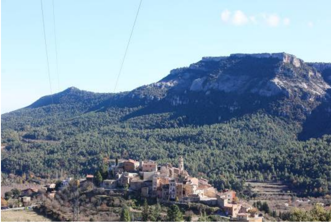
Panoràmica del poble de Capafonts, que formarà part del futur Parc Natural de les Muntanyes de Prades.

El Parc Natural de les Muntanyes de Prades, Poblet i la Serra de la Llena serà el segon més gran de Catalunya i el quinzè que es crea al país. Amb una extensió de 43.700 hectàrees repartides entre 24 municipis de l'Alt Camp, el Baix Camp, les Garrigues, la Conca de Barberà i el Priorat, el Govern preveu aprovar-lo definitivament durant el 2026. Tot i això, tal com declara el secretari de Transició Ecològica, Jordi Sargatal, «no sempre pot estar a gust de tothom» i ha implicat que durant el seu