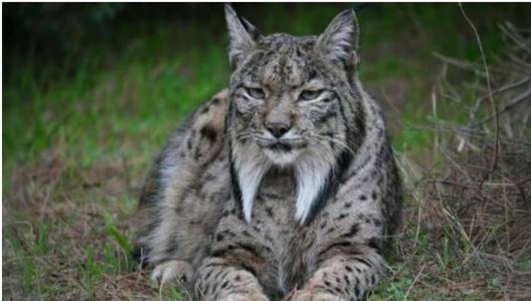
Un linx ibèric

"La lluita contra la fauna salvatge depèn de nosaltres", va dir el conseller d'Agricultura, Ramaderia, Pesca i Alimentació, Òscar Ordeig, en les últimes hores, en relació amb els compromisos que el Govern va adquirir amb els agricultors. Però a què es refereix Ordeig quan parla en termes de "lluita" i "control de plagues"?