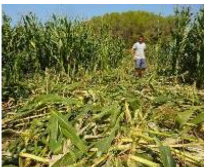
Destrosses dels senglars en un camp de blat de moro de Porqueres l'any 2012 RAMON ESTEBAN.

La temporada 2022/23 es va assolir el rècord amb 31.386 captures (73.000 a tot Catalunya), però cal no oblidar que la darrera dècada s'han eliminat més de 12.000 senglars anuals a