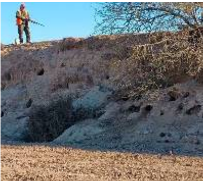
Batuda de conills a les planes de Lleida, la regió avui més perjudicada del país per danys als cultius

societat, en què la caça s'havia reduït a activitat de lleure i la protecció d'espais naturals havia creat reservoris d'espècies. Per exemple, als anys noranta els governs de Jordi Pujol havien començat a alliberar exemplars de cabirol, un cèrvid que gairebé havia desaparegut a Catalunya. El govern de Puigdemont constata que aquell canvi cultural havia "anat deixant en segon pla" la caça. Per no dir que, amb l'auge de la consciència ecologista urbanita, els caçadors tenien de feia anys mala premsa. L'any 2014 s'havien registrat 1.900 accidents de trànsit amb animals, un miler dels quals eren per causa del senglar –el 2021, el Departament d'Interior ja apuntava 5.032 accidents de trànsit; la majoria, per senglars–, 3.000 accidents anuals més que els comptats set anys abans. Senglars i conills, peces de caça que havien conviscut al segle XX amb l'agricultura del país, s'han convertit en una plaga que causa danys als cultius i les pastures, i accidents de trànsit. I el cabirol ha començat també a provocar danys.