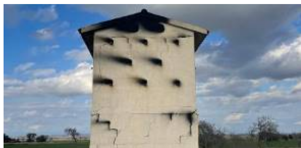
Una de les torres incendiades

Antonio Cerrillo – Barcelona - 12/02/2025