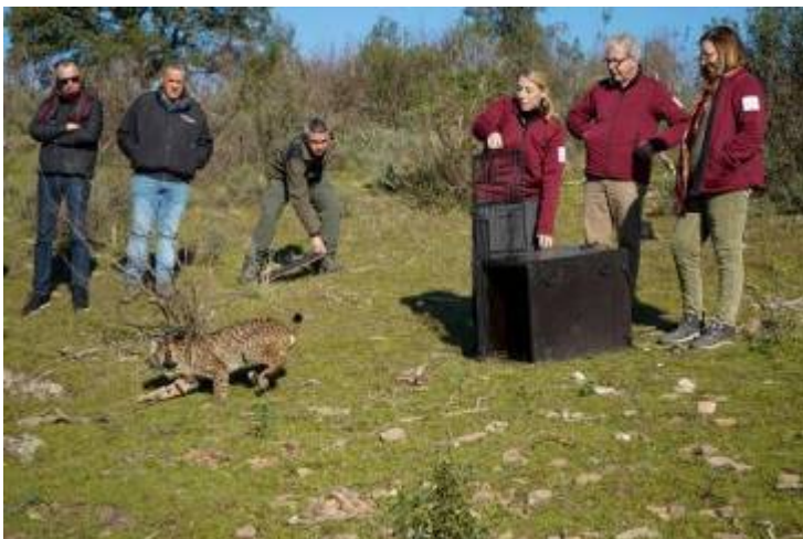
La presidenta de la Junta d'Extremadura, María Guardiola, participa a la solta d'Orvalho, un exemplar mascle de linx ibèric nascut en llibertat l'any 2017 i que va aparèixer a Extremadura l'octubre del 2019

I, així mateix, argumenta (i aquesta sembla que és la raó de fons) que temen que la reintroducció del linx comporti "limitacions i restriccions que vagin en contra de la producció agrària". És a dir que temen que s'implantïn certes restriccions per als agricultors quan s'introdueixi el linx, de la mateixa manera que quan es van crear les Zepas de Lleida es van implantar certes mesures a les pràctiques agràries per no perjudicar les aus estepàries endèmiques protegides. Tot i això, la reintroducció s'ha pogut dur a terme a diverses comunitats d'Espanya i no ha ocasionat cap problema de convivència. El retorn a aquestes noves comunitats no s'ha fet per controlar els conills sinó per donar l'espai vital a una espècie que va estar a punt de desaparèixer i ampliar les funcions ecològiques.