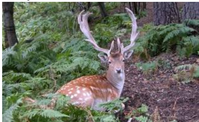
Una daina en una zona boscosa del Pallars Sobirà ARXIU.

Aina Argueta – barcelona - 9 febrer 2025