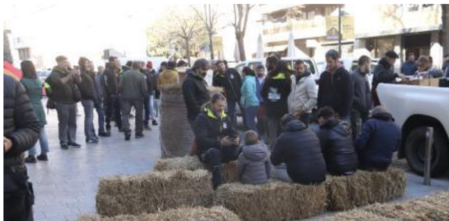
Protesta davant la Delegació del Govern a Girona.

Antonio Cerrillo – Barcelona - 11/02/2025