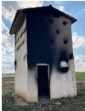
L'altra construcció incendiada

Diverses fonts consideren que el succés no és una vulgar gamberrada sinó que s'assembla a un "acte de terrorisme" la finalitat del qual és llançar el missatge: "prepareu-vos si no feu el que nosaltres diem".