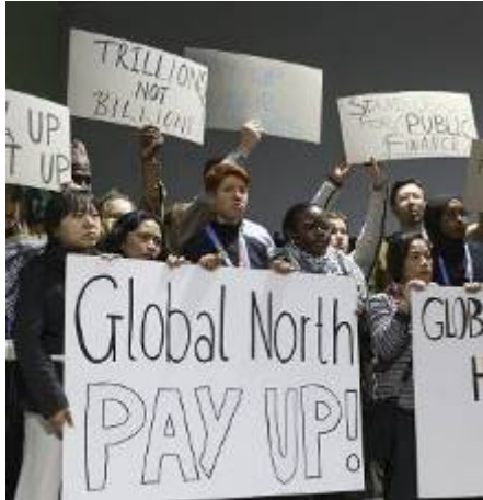
Protesta d'activistes, davant de la seu de la COP29, a Bakú.