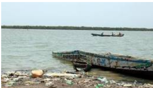
El riu Casamance, que centra el projecte per combatre la salinització del seu delta

Els països en vies de desenvolupament han acceptat 300.000 milions de dòlars cada any en ajudes climàtiques dels països rics. Així consta en l'acord de la cimera del clima que s'ha tancat in extremis la matinada de diumenge a la COP29 de Bakú, a l'Azerbaidjan. Aquests diners aniran destinats a cobrir els costos de la transició energètica, de l'adaptació al canvi climàtic i dels desastres naturals causats per l'escalfament global del planeta. L'aportació queda lluny del bilió de dòlars anuals que reclamaven els països pobres, però triplica el compromís anual que fins