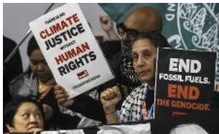
Una protesta a Bakú reclamant justícia climàtica i respecte als drets humans durant la COP29 ANATOLY MALTSEV / EFE.

J. Guillamon – barcelona - 11 novembre 2024