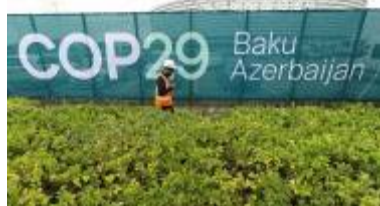
La cimera climàtica de l'ONU COP29 arrenca aquest dilluns a Bakú, Azerbaidjan.

La victòria de Donald Trump als Estats Units dispara l'ecoansietat. L'onada expansiva del seu triomf arribarà aquest dilluns a Bakú, a l'Azerbaidjan, on arrenca la cimera anual de l'ONU contra la crisi climàtica, i reduirà les perspectives ja minses que s'hi arribi a un acord ambiciós. L'equip nord-americà que negociarà en aquesta cimera, la COP29, encara serà l'enviat per Joe Biden, que no deixa la presidència fins al 20 de gener del 2025. Però conscients que Trump tornarà a treure els Estats Units de l'Acord de París –com va fer en el seu primer mandat– i desfarà tots els seus esforços, aquest equip difícilment jugarà ja el paper clau que s'esperava.