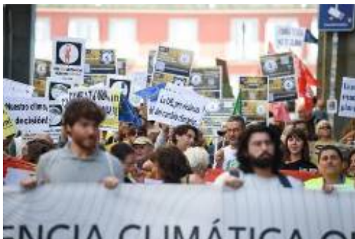
Desenes de persones durant una manifestació en defensa de la justícia climàtica a Madrid (Espanya).

A l’abril, el Tribunal Europeu de Drets Humans (TEDH) va publicar una sentència inèdita en què va castigar la passivitat legislativa de Suïssa en l’adopció de mesures concretes davant del canvi climàtic i els seus efectes perniciosos en la salut de les persones. Les demandants van ser un grup de dones més grans de 65 anys, les “àvies pel clima”, que van anar a Estrasburg en entendre que el seu país estava violant els seus drets més bàsics en no adoptar cap política efectiva contra l’escalfament global.