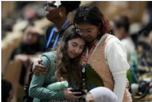
Assistents s’abracen a la sessió plenària de cloenda de la Cimera sobre el Clima de l’ONU COP29

Les audiències a l’Haia se celebraran amb els ressos de la COP29 de Bakú (Azerbaidjan) ressonant, on els països rics es comprometen a destinar 300.000 milions de dòlars anuals a partir del 2015 a les nacions en vies de desenvolupament per costejar l’acció climàtica.