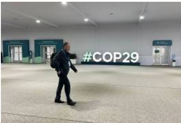
Sala buida de la COP29, clausurada aquest diumenge a Bakú (Azerbaidjan)

Anna Balcells – BARCELONA - 24 novembre 2024