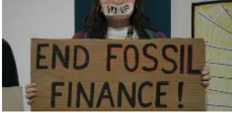
Manifestant a la COP de Bakú, a l'Azerbaidjan

Antonio Cerrillo /Agències – Barcelona - 24/11/2024