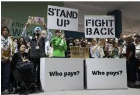
Un grup d'activistes, reclamant un finançament climàtic just, aquest dissabte a Bakú

Anna Balcells – BARCELONA - 23 novembre 2024