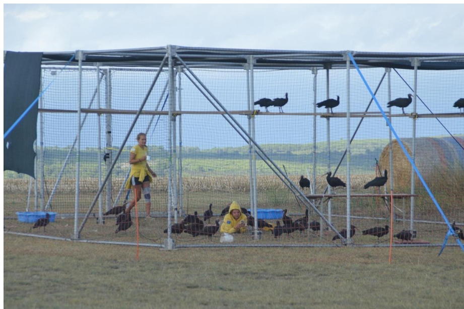
Els ibis migradors reposant a Ordis amb les seves "mares"

Els ocells, com ja ha passat en anteriors temporades, es desplacen guiats per un equip de científics que viatgen en ultralleugers, entre els quals hi ha dues biòlogues que exerceixen de mares de les aus.