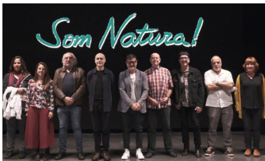
Foto de grup d'alguns dels músics implicat a la iniciativa AJUNTAMENT DEL PRAT DE LLOBREGAT.

ACN - EL PRAT DE LLOBREGAT - 21 octubre 2021