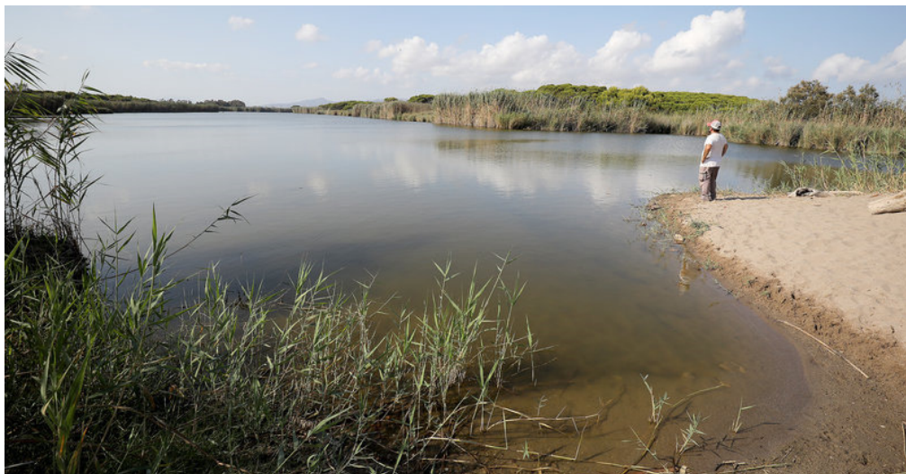
La llacuna de la Ricarda, una de les zones protegides del delta JUANMA RAMOS.

REDACCIÓ - EL PRAT DE LLOBREGAT - 19 octubre 2021