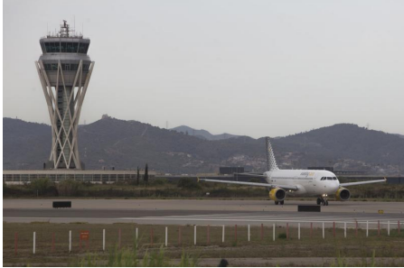
Vista de l'aeroport del Barcelona-El Prat ORIOL DURAN.

El president de la Generalitat, Pere Aragonès, ha assegurat aquest diumenge que no hi ha “cap nova proposta” acordada pel govern per l'ampliació de l'Aeroport del Prat.