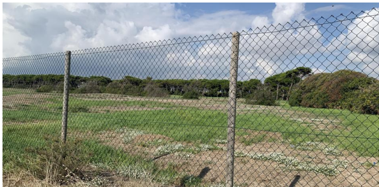
L'antic camp de golf del Prat està cridat a ser un corredor biològic però roman tancat LV

JOSE POLO - EL PRAT DE LLOBREGAT - 18/10/2021