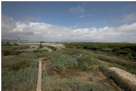
El delta del Llobregat J.RAMOS.

El síndic de greuges, Rafael Ribó, ha mantingut una reunió amb l'equip del Defensor del Poble de la Unió Europea per parlar de diversos problemes relacionats amb el medi ambient a Catalunya i, en concret, ha plantejat el compliment de la normativa europea de protecció dels deltes de l'Ebre i del Llobregat, en aquest últim cas pel possible projecte d'ampliació de l'aeroport del Prat. També ha aprofitat per abordar l'increment del preu de l'electricitat.