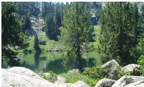
El Pirineu tindrà més protecció . JOAN RUEDA.

El Parc Natural de l'Alt Pirineu, juntament amb el Parc Regional dels Pirineus d'Arieja a França i els andorrans de la Vall de Sorteny i Comunal de les Valls de Comapedrosa, va iniciar divendres amb la signatura d'un protocol el camí cap a la seva promoció conjunta a través d'una nova marca que els aglutina sota el paraigua de Parc Pirinenc de les Tres Nacions. La unió de les quatre àrees protegides suma més de 428.700 hectàrees i es converteix d'aquesta manera en una de les més extenses d'Europa d'àmbit transfronterer, i estan distribuïdes per 158 municipis, una quinzena dels quals són catalans, dos més són del Principat d'Andorra i 141 francesos.