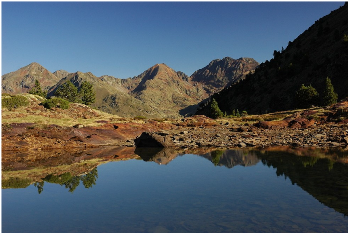
La Pica d'Estats reflexada sobre l'estanyet d'Aixeus | PNAP

Representants dels quatre parcs naturals de Catalunya, França i Andorra que integren, entre tots ells, el Parc Pirinenc de les Tres Nacions han acordat la imatge corporativa que identificarà l'espai natural protegit transfronterer, en el marc d'aquest projecte de promoció turística conjunta. El disseny posa de relleu l'aliança de les parts, mitjançant el dibuix de tres muntanyes disposades en un cercle que les uneix, amb els colors de les banderes de les tres nacions implicades, i amb el text tant en català com en francès.