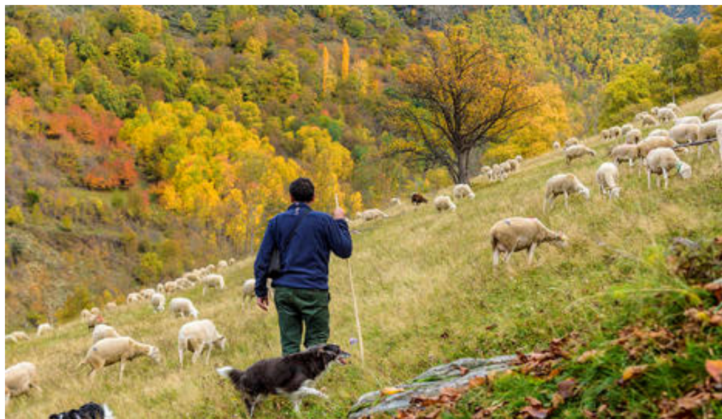
© Vista del Parc Natural de l'Alt Pirineu Felipe Valladares

Es tracta d'una marca d'identitat comuna per al Parc Natural de l'Alt Pirineu, el Parc Natural Regional de Pyrénées Ariégeoises, el Parc Natural de la Vall de Sorteny i el Parc Natural Comunal de les Valls del Comapedrosa