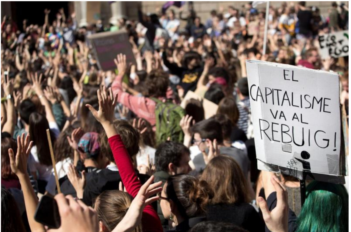
Manifestació d'estudiants contra el canvi climàtic, aquest divendres a Barcelona.

Agències - Barcelona/Girona - 15 març 2019