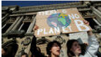
Els divendres contra el canvi climàtic arriben a Barcelona

Thunberg va començar fa un any a fer vaga cada divendres per protestar davant del Parlament suec i reclamar mesures contra el canvi climàtic. Joves d'arreu del món l'han imitat i han generat un moviment batejat com a School Strike 4 Climate, Fridays for Future o Youth for Climate, que ja ha arribat fins a Catalunya.