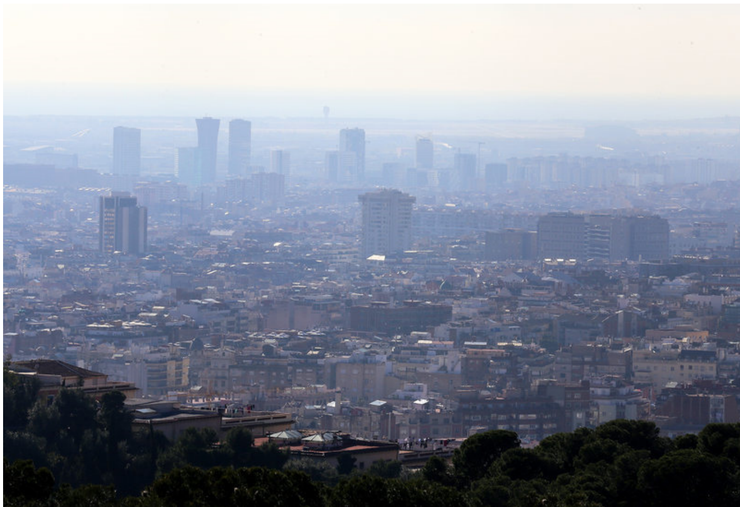
Vista de Barcelona des del Carmel el gener passat, cobert per una densa capa de contaminació atmosfèrica J. RAMOS / ARXIU.

La mortaldat prematura causada per la contaminació ascendeix ja a milions de persones, i a altres organismes vius no comptabilitzats. Fins al 2050, la tendència anirà a l'alça si no s'accelera la implantació de mesures de protecció del medi ambient. L'alerta la va donar ahir l'ONU en la presentació de l'Informe Mundial del Medi Ambient, durant l'assemblea que l'organització internacional celebra a Nairobi (Kenya).