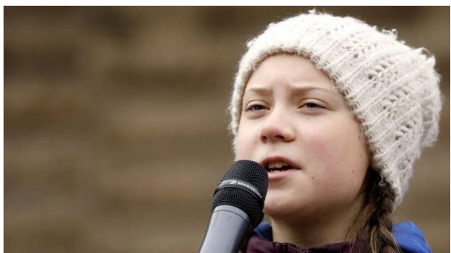
Greta Thunberg, durant un acte per reclamar mesures urgents contra el canvi climàtic, a Hamburg, el passat 1 de març.

Carlos Márquez Daniel - Estocolm - Dijous, 14/03/2019