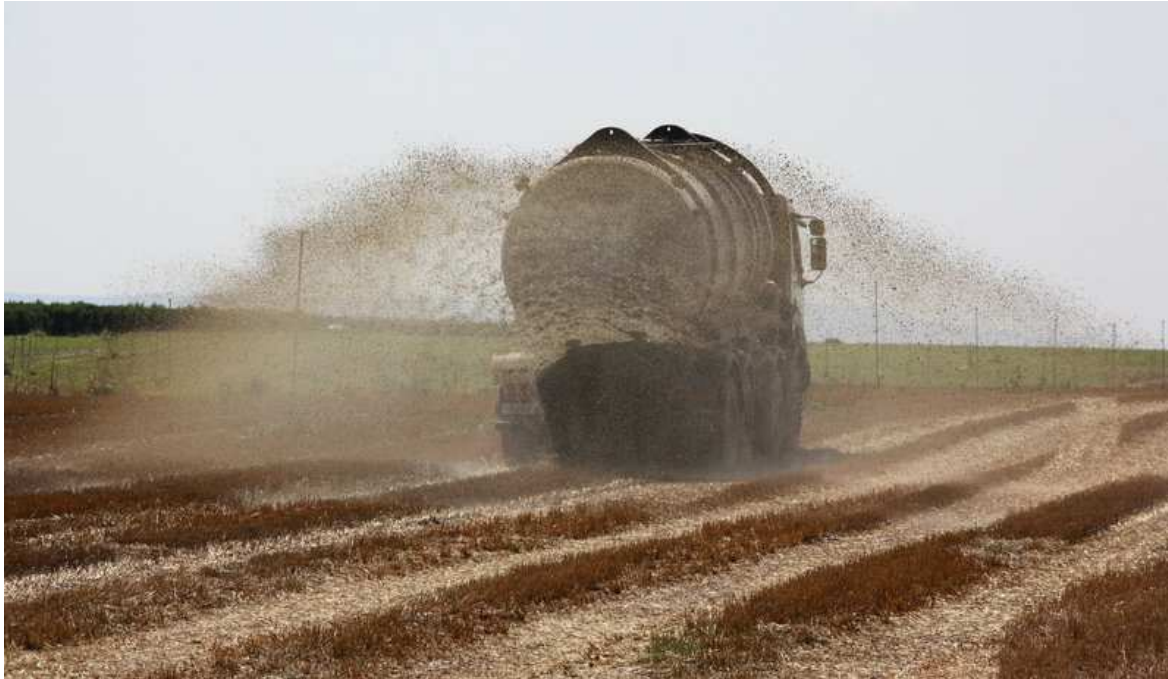
Un camió cisterna llençant purins en una finca