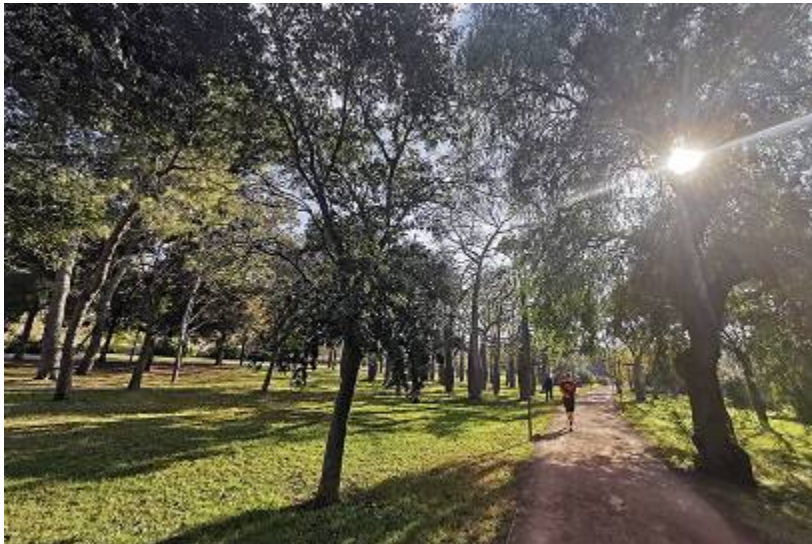
Jardí de l'antic llit del riu Túria.