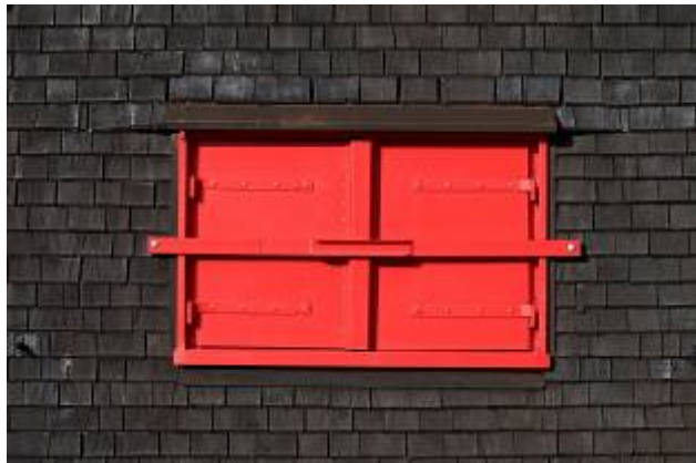
Imatge de PIRO a Pixabay

Em costà triar el nom per a aquesta secció de Mètode, tan difusa i mal·leable, i tanmateix ara em sembla que no en podria haver escollit cap altre. «Diccionaris futurs», en plural; això també és important, car el pervindre no s'escriu només amb un sol manual lingüístic, sinó amb molts. Canvien els mots i, amb ells, els anys que vindran. N'inventem de nous, i això ens esperança, perquè al darrere les lletres hi ha significats profunds que esperen a ser articulats, verbalitzats. El nom fa la cosa si parlem d'imaginar. Recuperem arcaïsmes en desús, relegats fins ara a pàgines grogues o tractats de l'antiguitat, que així i tot encaixen perfectament al puzzle indòmit del segle XXI. Però també, i heus ací el que veritablement em preocupa, estem arrencant pàgines senceres dels diccionaris, negant-