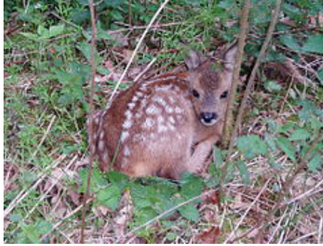
Cria de cabirol d'unes dues o tres setmanes.