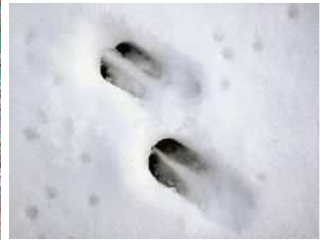
Petjades de cabirol.

El cabirol és un animal predominantment forestal, que surt a camp obert en comptades vegades durant l'estiu per afegir algunes herbes a la seva dieta, basada en el consum de fulles d'arbusts i arbres baixos, així com baies i brots tendres. Els seus hàbits són crepusculars, es pot observar-lo poques vegades durant el dia, que sol passar amagat entre l'espessa vegetació.