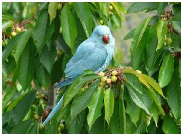
Cotorra de Kramer en un cirerer, exemplar observat pel grup A

Esparver, Astor, Aligot comú, Xoriguer, Falcó pelegrí, Perdiu roja, Faisà, Polla d'aigua, Tudó, Colom roquer, Tórtora turca, Tórtora, Cucut, Gamarús, Ballester, Falcot negre, Colltort, Picot verd, Picot garser gros, Roquerol, Oreneta vulgar, Oreneta cuablanca, Cuereta blanca, Cuereta torrentera, Cargolet, Pit-roig, Rossinyol, Merla blava, Merla, Tord, Rossinyol bord, Bosqueta vulgar, Tallarol de casquet, Tallarol capnegre, Mosquiter pàl·lid, Bruel, Mastegatxes, Mallerenga emplomallada, Mallerenga blava, Mallerenga carbonera, Mallerenga petita, Mallerenga cuallarga, Raspinell, Estornell vulgar, Estornell negre, Oriol, Gaig, Garsa, Corb, Pardal xarrec, Pardal comú, Pinsà, Gafarró, Verdum, Cadenera, Gratapalles i Cotorra de Kramer.