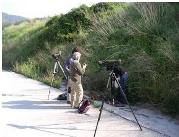
Fotografia del grup C, observant la flora també

El mateix dia també es detectaren, fora de la marató, dues espècies més: Puput ( Upupa epops ) i Cotxa fumada ( Phoenicurus ochruros ).